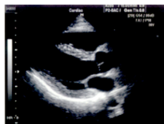
Parasternal long-axis view with pulse inversion harmonic imaging activated